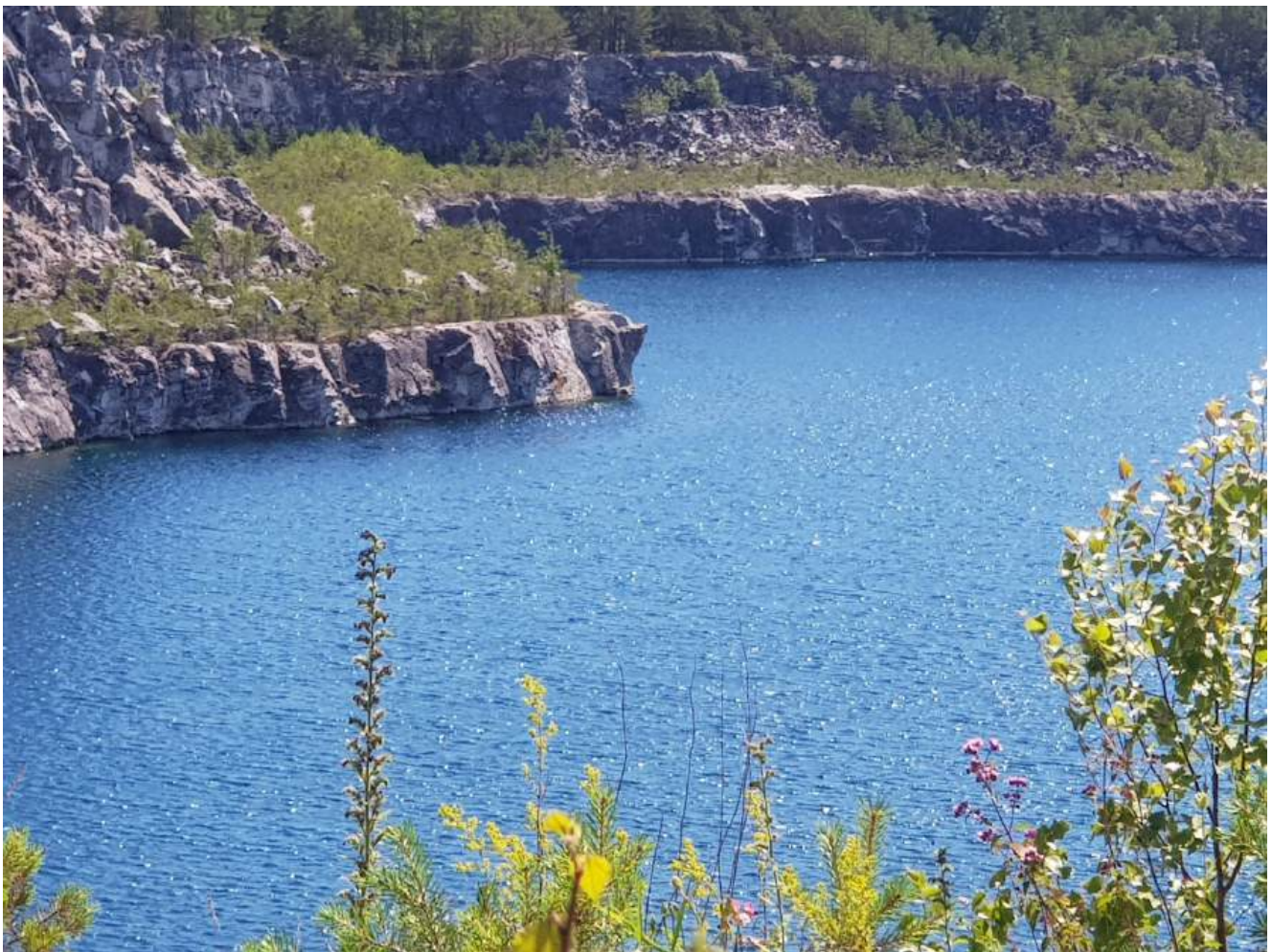
Bildtext: Stora Vika kalkbrott är under sommaren ett populärt mål för badgäster. Dock är det fortfarande privat.

https://www.kolada.se/verktyg/jamforaren/?_p=jamforelse&focus=16560&report=84575&tab_id=170469