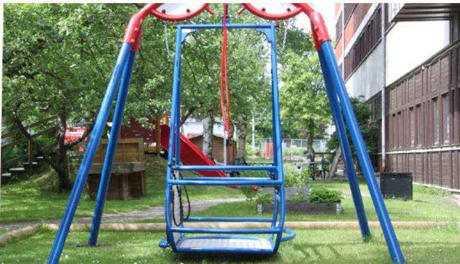
Bildtext: Rullstolsgunga, foto Stockholms stad

Att erbjuda kultur i skolorna innebär att alla barn och ungdomar får del av den, vilket är mycket betydelsefullt. Det är också av största vikt att alla kommuninvånare får möjligheter till kultur- och fritidsaktiviteter och att dessa aktiviteter erbjuds på ett inkluderande sätt, så att till exempel äldre och personer med funktionsvariationer också kan delta.