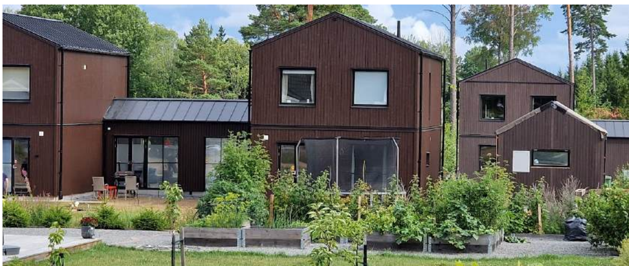
Bild från det nybyggda området i Sanda i Sorunda.

Vi vill utreda möjligheterna att öppna skolorna i Stora Vika och Fagervik. Efter stängningen av dessa skolor har det nu blivit för trångt i Kyrkskolan. Det är inte acceptabelt med 31 elever i Förskoleklass. Det finns inte grupprum och klassrummen räcker inte till. Planering behöver också startas för var eleverna som flyttar in i Sanda, Hoxla, Gudby, Valsta, Lyngsta, Segersäng, Källberga, Ösmo och Nynäshamn ska gå i skolan. Bara i Sorunda är 120 nya bostäder byggda eller under byggnation, de flesta villor, vilket gör att det blir många barnfamiljer som flyttar in. Trots detta har 450 elevplatser tagits bort från Sorunda under de senaste åren.