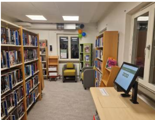
Sorunda bibliotek i "Vita Villan".