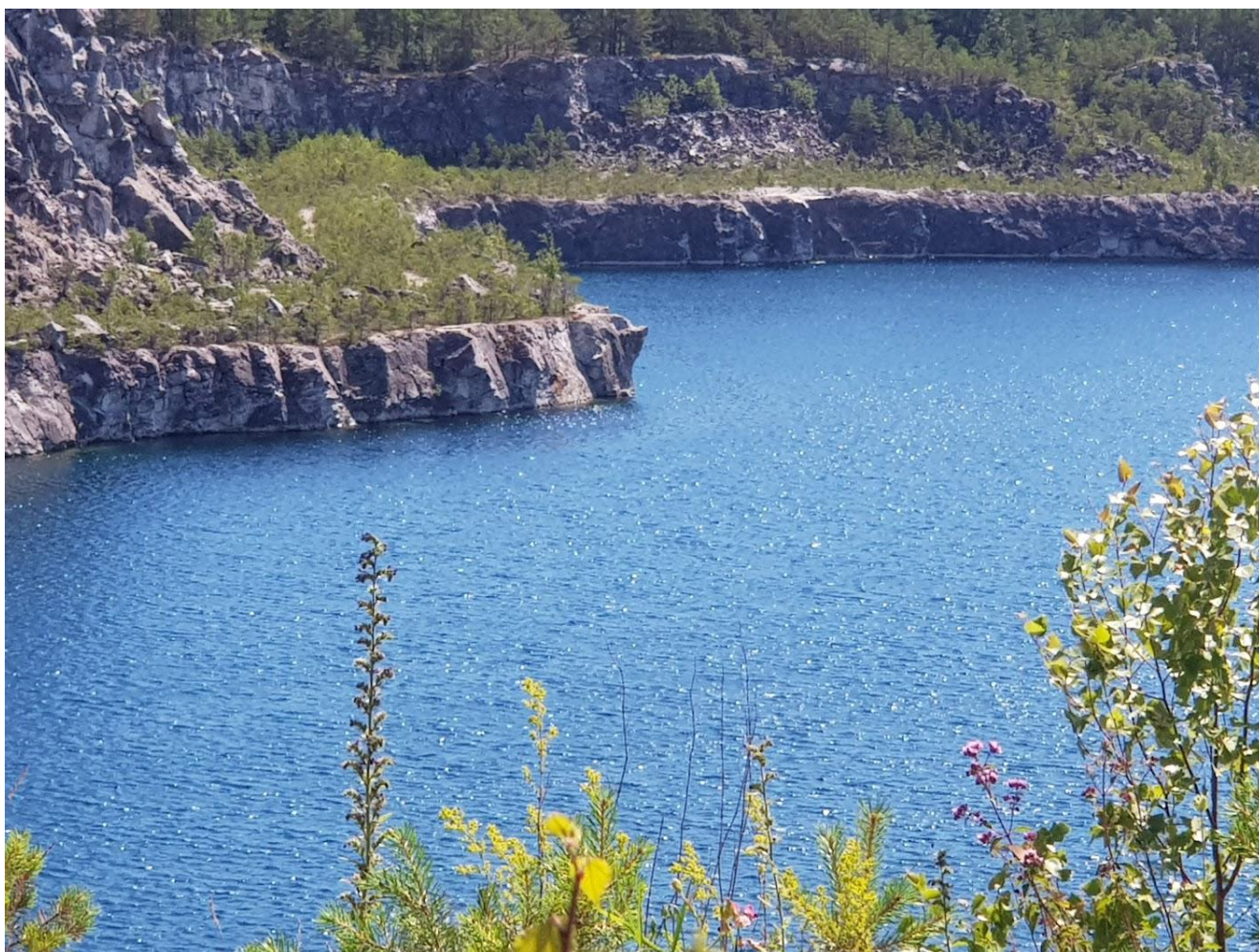
Bildtext: Stora Vika kalkbrott är under sommaren ett populärt mål för badgäster. Dock är det fortfarande privat.

https://www.kolada.se/verktyg/jamforaren/?_p=jamforelse&focus=16560&report=84575&tab_id=170469