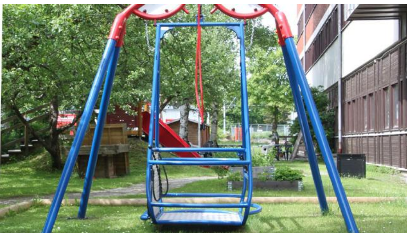
Bildtext: Rullstolsgunga, foto Stockholms stad

Att erbjuda kultur i skolorna innebär att alla barn och ungdomar får del av den, vilket är mycket betydelsefullt. Det är också av största vikt att alla kommuninvånare får möjligheter till kultur- och fritidsaktiviteter och att dessa aktiviteter erbjuds på ett inkluderande sätt, så att till exempel äldre och personer med funktionsvariationer också kan delta.