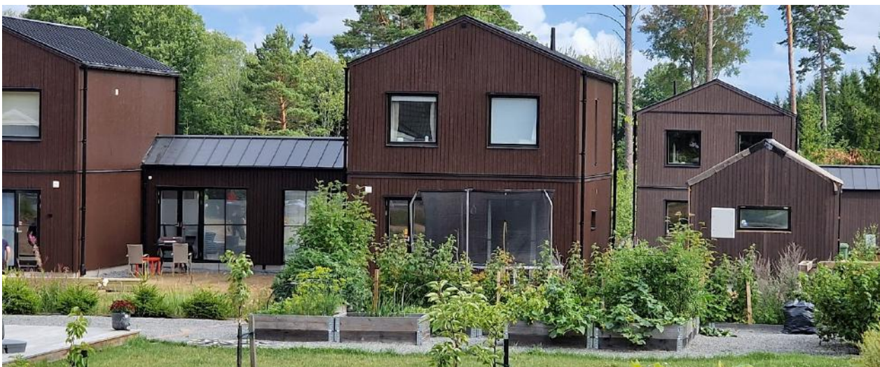
Bild från det nybyggda området i Sanda i Sorunda.

Vi vill utreda möjligheterna att öppna skolorna i Stora Vika och Fagervik. Efter stängningen av dessa skolor har det nu blivit för trångt i Kyrkskolan. Det är inte acceptabelt med 31 elever i Förskoleklass. Det finns inte grupperum och klassrummen räcker inte till. Planering behöver också startas för var eleverna som flyttar in i Sanda, Hoxla, Gudby, Valsta, Lyngsta, Segersäng, Källberga, Ösmo och Nynäshamn ska gå i skolan. Bara i Sorunda är 120 nya bostäder byggda eller under byggnation, de flesta villor, vilket gör att det blir många barnfamiljer som flyttar in. Trots detta har 450 elevplatser tagits bort från Sorunda under de senaste åren.