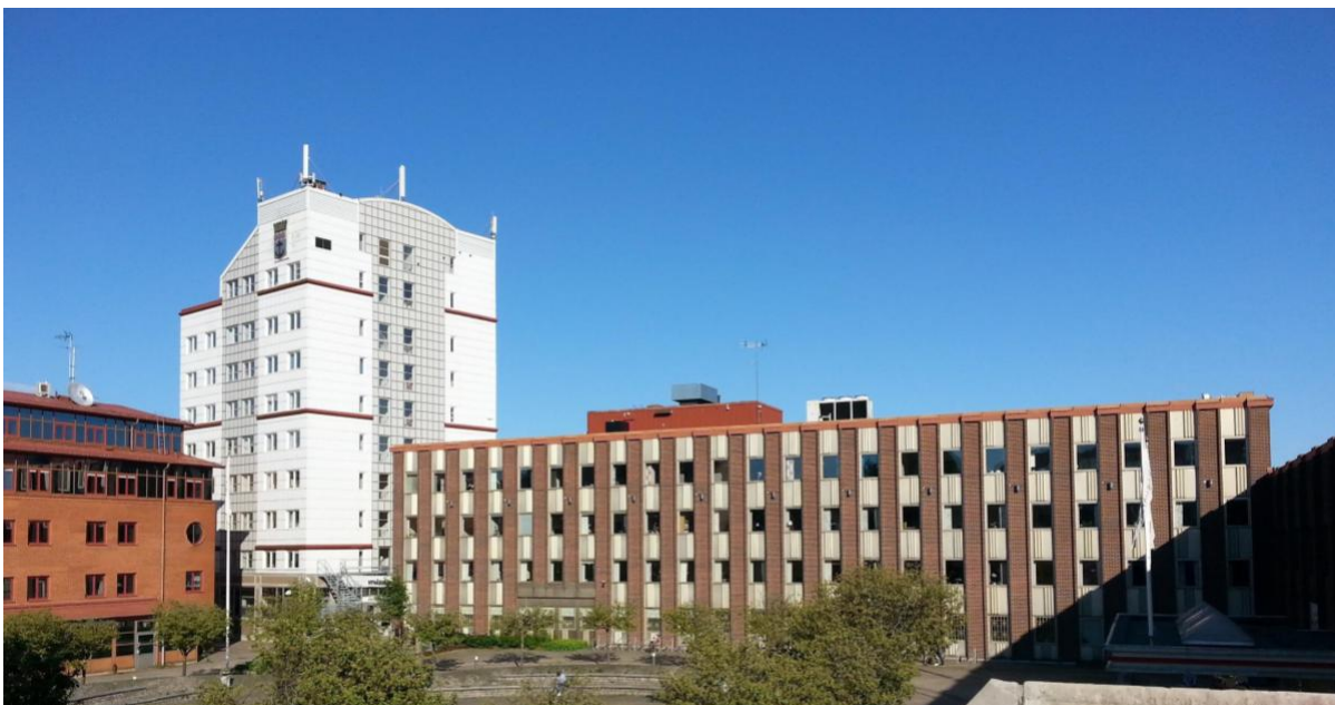
Administrativt centrum och kommunhus finns i samhället Nynäshamn

Kommunstyrelseförvaltningen utgör också kanslifunktion för kommunstyrelsen, kommunfullmäktige och valnämnden.